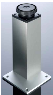
NOŽKA - HLINÍK

U vestavěného a na stavbu navazujícího nábytku je nutné před jeho výrobou zaměřit skutečné rozměry stavebních konstrukcí !!